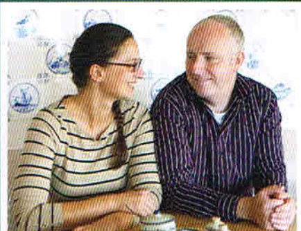
Küsten-Küche Zu Besuch bei den Friesen