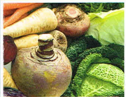
Kraut & Rüben Wohlfühl-Wintergemüse