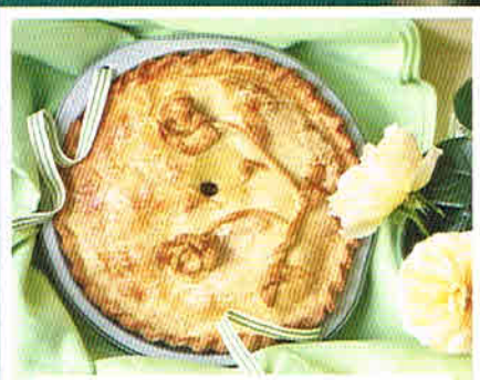
Von deftig bis süß Köstlichkeiten zur Tee-Zeit