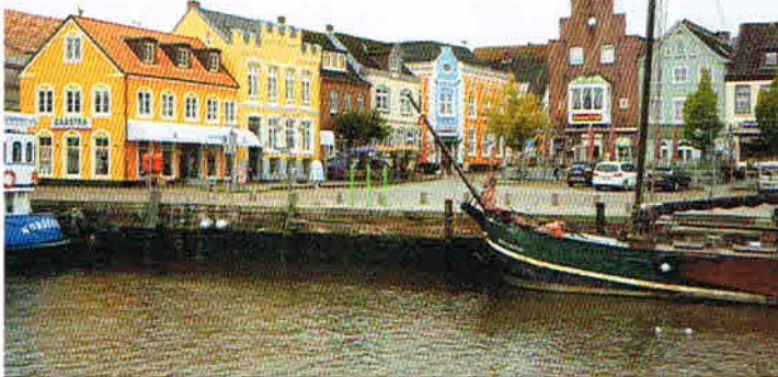
Die kleine Küstenstadt Husum erreicht man von Bohmstedt aus in circa einer Viertelstunde